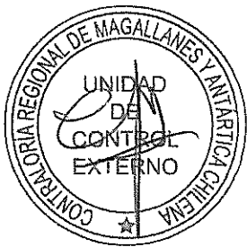
JEFE UNIDAD CONTROL EXTERNO SUBROGANTE Contraloría Regional de Magallanes y de la Antártica Chilena